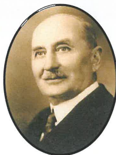
1927 à 1939 Félix Messier Libéral

Né en 1876 et décédé en 1968, il a rempli les fonctions de maire de Saint-Antoine-sur-Richelieu et de préfet du comté de Verchères.