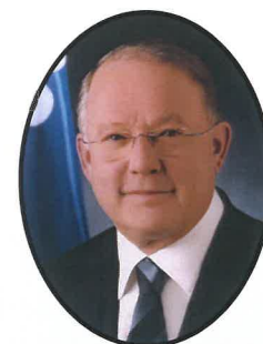
1994 à 2005 Bernard Landry Parti Québécois

Ingénieur de formation, il a occupé plusieurs postes de ministre sous Robert Bourassa. Il est Compagnon de l'Ordre du Canada.