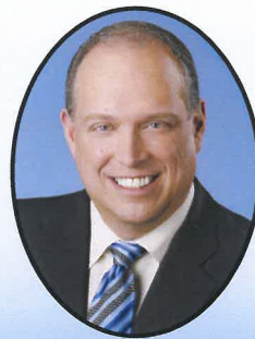
2005 à aujourd'hui Stéphane Bergeron Parti Québécois

Ministre de la sécurité publique sous Pauline Marois de 2012 à 2014 et député à la Chambre des communes de 1993 à 2005.