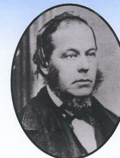
1878 à 1879 Jean-Baptiste Brousseau Libéral

Il vécut de 1841 à 1925 et a été procureur de la Couronne et député à la Chambre des communes.